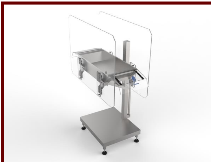
Elektromos kábító berendezés

Feladata, hogy a felsőpályán folyamatosan érkező baromfik kábítását az elvárt technológiai paraméterek mellett, az állatvédelmi előírások betartásával végezze el. Ez az egyik előfeltétele a jó minőségű végtermék előállításának is, és ez segíti elő a jó kivérzést, valamint a megfelelő kopaszthatóságot is.