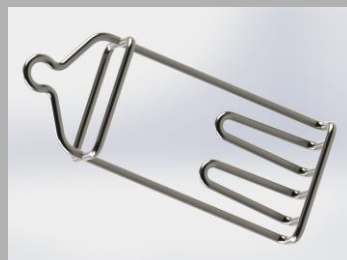
Horog - csirke

A gerendák magassága külön-külön, menetközben is állítható, a gép szélessége a két végén elhelyezett menetes orsók segítségével szintén állítható. Ezek segítségével lehet a gépet tisztításkor vagy gumiujjak cseréjénél szétnyitni.