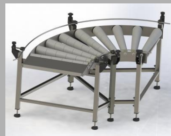
Íves görgős szalag